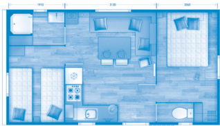
Mobil homes 2 chambres

* Taxe de séjour non comprise (0,61 € par nuitée et par personne de plus de 18 ans).